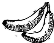
2 - banane