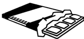
5 - chocolat