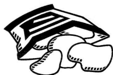
9 - chips