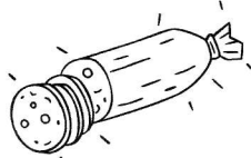
6 - saucisson