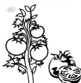
7 - tomate