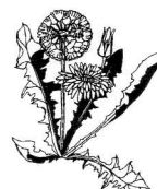
13 - pissenlit