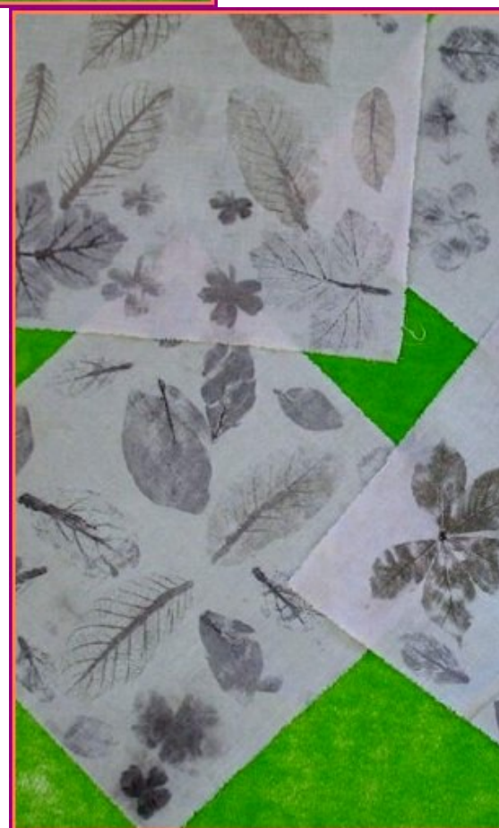
Décoration de Napperons avec des Feuilles Martelées