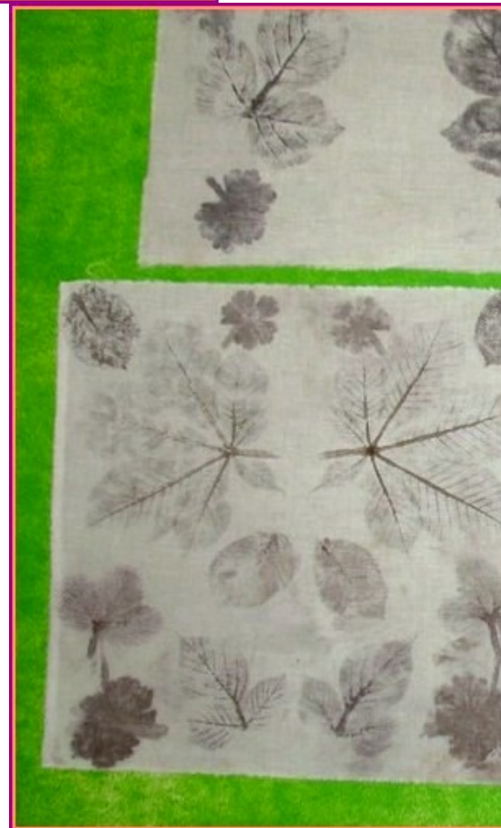
Décoration de Napperons avec des Feuilles Martelées