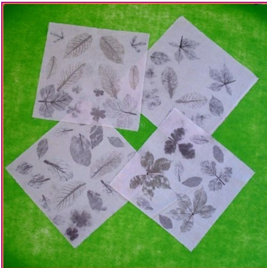
Décoration de Napperons avec des Feuilles Martelées