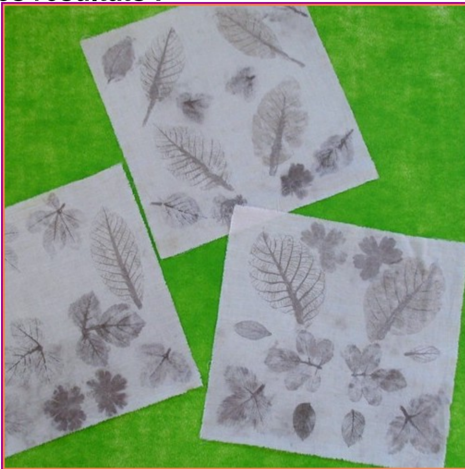
Décoration de Napperons avec des Feuilles Martelées