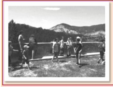
Au Château d'Aulan