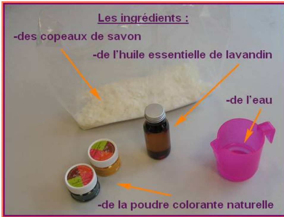
A l'Ecole. Les Ingrédients