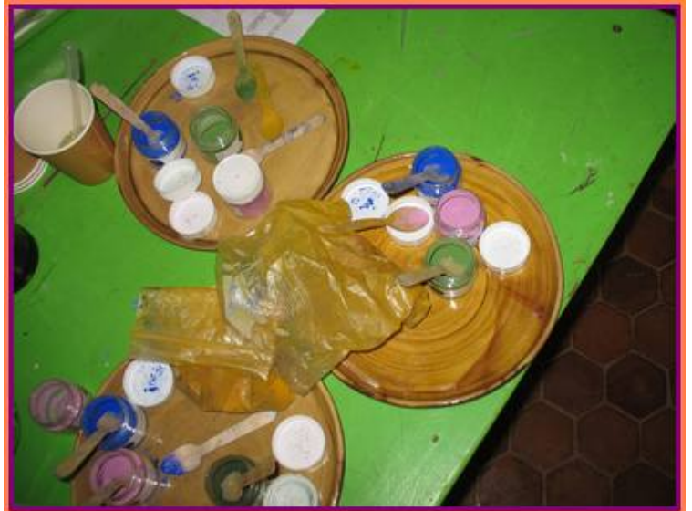
A la Maison des Plantes. Les Poudres pour colorer